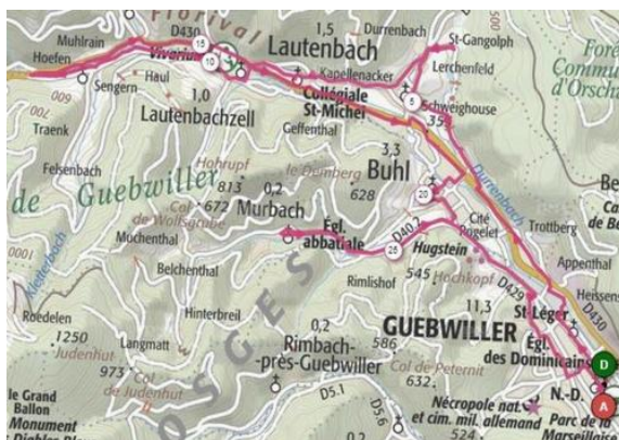
Le parcours route de 30 kilomètres présente un dénivelé positif de 375 mètres pour grimper sur les hauteurs du Florival.

Découvrir le Florival à vélo lors de sorties encadrées par les membres de l'association des cyclotouristes du Florival, c'est ce que proposera l'ACTF (association des cyclotouristes du Florival) samedi 29 mai.