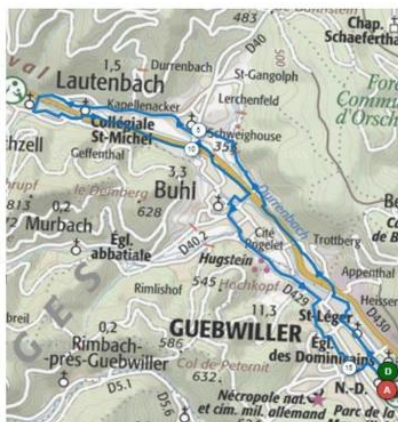
Le premier parcours route et VTT de 15 kilomètres est de niveau facile avec un dénivelé positif de 160 mètres. D R

Parcours 1 Commun Route & VTT Distance: 15km Dénivelé: +160m Difficulté circuit: vert